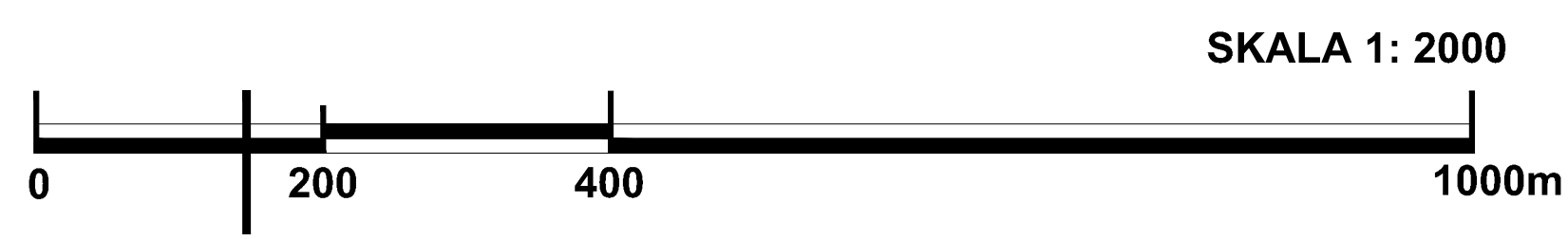
Załącznik Nr 2 do Prognozy Oddziaływania na Środowisko