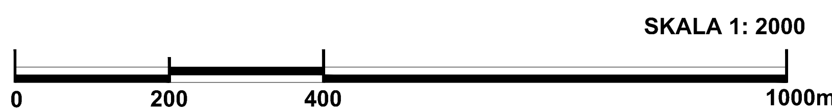
Załącznik Nr 5 do Prognozy Oddziaływania na Środowisko